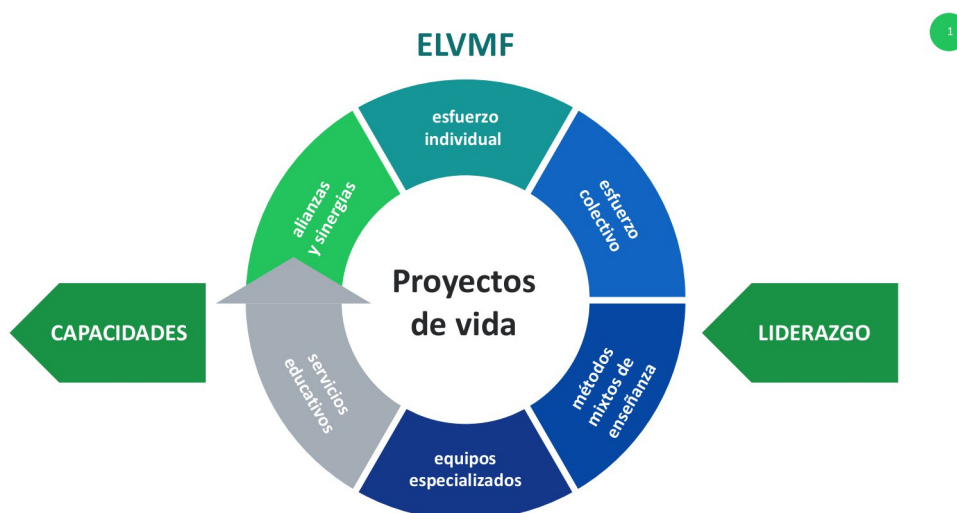
Esquema base de la esencia en la ELVMV (proyectos de vida)

La ELVIMEF cuenta con socios estratégicos en los países del Sistema de la Integración Centroamericana, así como socios con entidades académicas que impulsan la educación virtual a nivel internacional.